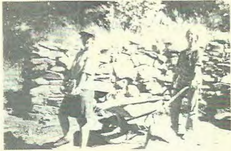
Chantier CONCORDIA 1993