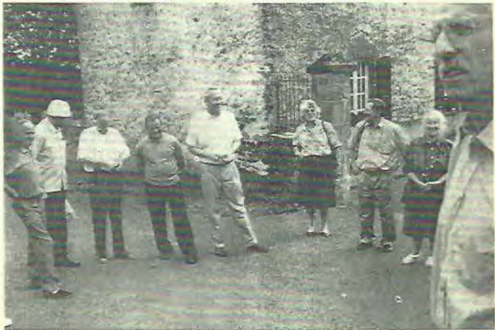
Visite de nos amis hollandais de V.V.A. (1994)