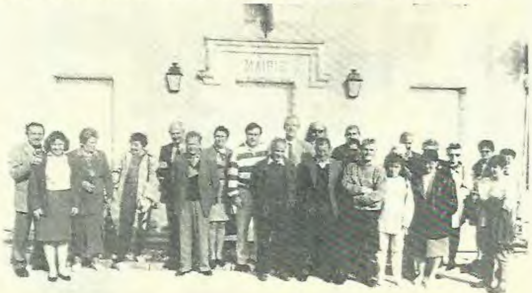
Visite à Notre Dame d'Oe (mai 1995)