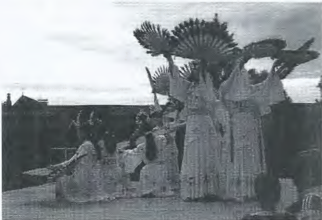
Fête de Chaussenac : le groupe de TAIWAN : musique, danses, costumes, ...