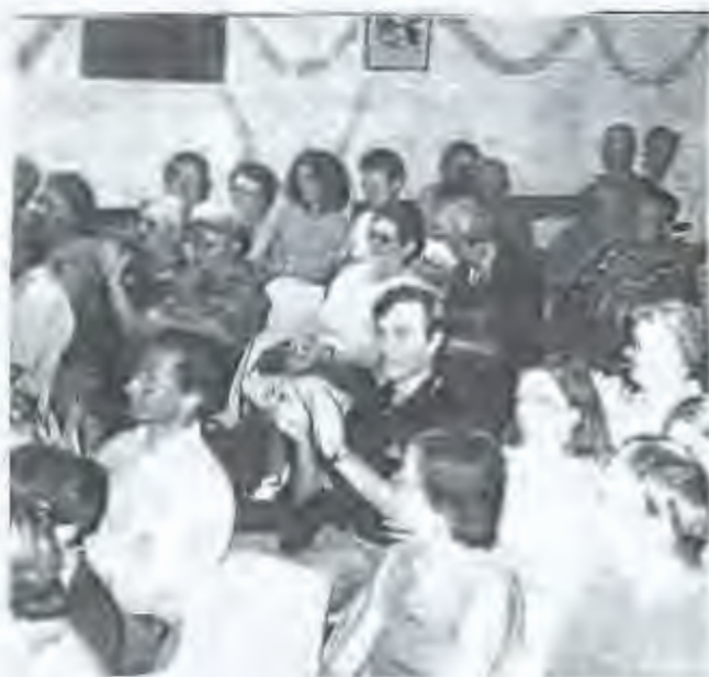
Soirée contes et diaporama.

Et ici là nous souhaitons à nos fidèles adhérents une bonne entrée dans l'ère nouvelle.