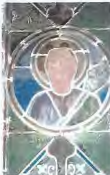
Vitrail devant bénéficier d'une restauration.