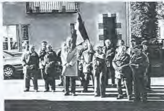
Cérémonie du 11 novembre 2001.

Nous avons également été nombreux à participer aux cérémonies commémoratives du 11 novembre et au banquet qui a rassemblé 35 personnes.