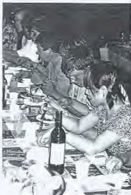
Quelques photos-souvenirs du chantier au moulin d'Ostenac.