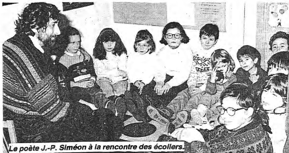
Le poète J.-P. Simeon à la rencontre des écoliers.

L'effectif actuel est donc de 23 élèves (11 CE-CM et 12 CP-Maternelle).